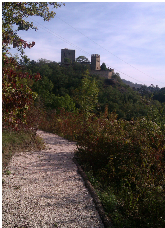
Foto 1: percorso pedonale con scorcio sul Castello di Gropparello