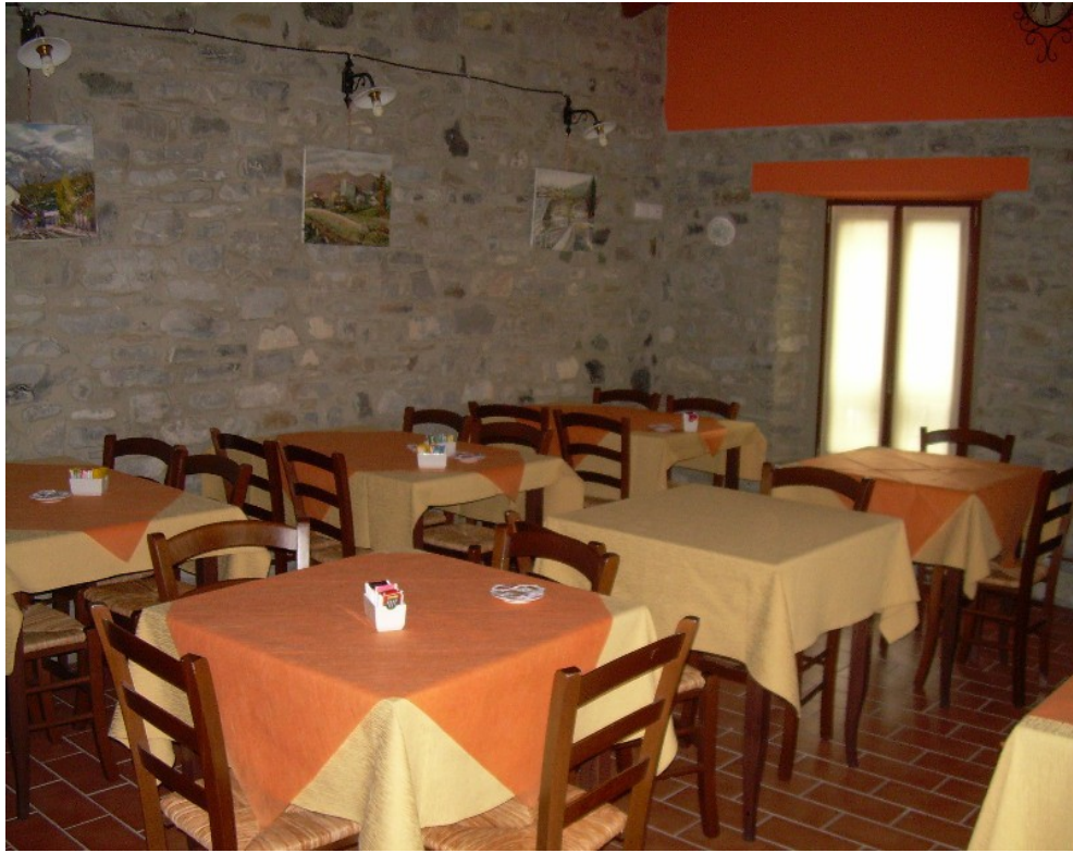
Foto7: Sala ristorazione