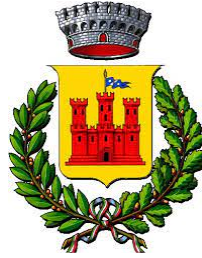
Comune di Sarmato

INTEGRAZIONE E AGGIORNAMENTO ALL'ACCORDO TERRITORIALE sottoscritto in data 27 marzo 2012 tra la Provincia di Piacenza e il Comune di Sarmato RELATIVO AL POLO PRODUTTIVO DI SVILUPPO TERRITORIALE (PPST) N. 5, CON VALENZA DI AREA PRODUTTIVA ECOLOGICAMENTE ATTREZZATA (APEA) DI RILIEVO SOVRACOMUNALE, AL NUOVO POLO FUNZIONALE (PF) N. 6 E ALLA GRANDE STRUTTURA DI VENDITA (GSV) N. 6 DENOMINATI "EX ERIDANIA", AI SENSI DELL'ART. 58, COMMA 1 DELLA L.R. N. 24/2017 E DEGLI ARTT. 85, 91, 93 E 114 DELLE NORME DEL PIANO TERRITORIALE DI COORDINAMENTO PROVINCIALE (PTCP)